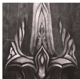
イラストレーション 心の中の正義の武器 小林 健太