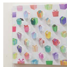
ビジュアル表現 Gift Panel 神谷 真莉子