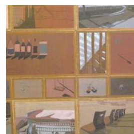
イラストレーション 影 樺澤 初美