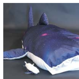
製品デザイン voyager 草間 優菜