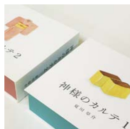
パッケージデザイン 神様のカルテセット 大日方 春奈