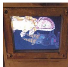
アニメーション クルクルフィッシュ 望月 裕也