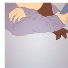
イラストレーション 日本の女性 塚田 彩華