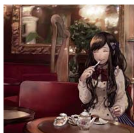
イラストレーション 空想喫茶 長張 園