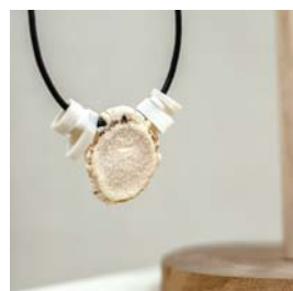
アクセサリ deer 竹前 くるみ

学校に行けず不登校に悩む小・中学生のための選択肢として「中間教室」があります。この中間教室は長野にしかない教育機関で、その存在を広く知ってもらうためにポスターを制作しました。私自身も不登校に悩み、中間教室に通っていました。当事者だった自分にしかできない表現を目指し、今まさに不登校に悩んでいる小・中学生に共感してもらえるように心がけました。