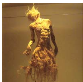
立体造形 塊 高橋 幸男