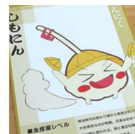
キャラクター かるた 宮下 一成